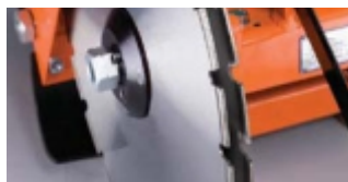
MONTARE DISC DUBLU (DOAR CS451 E)